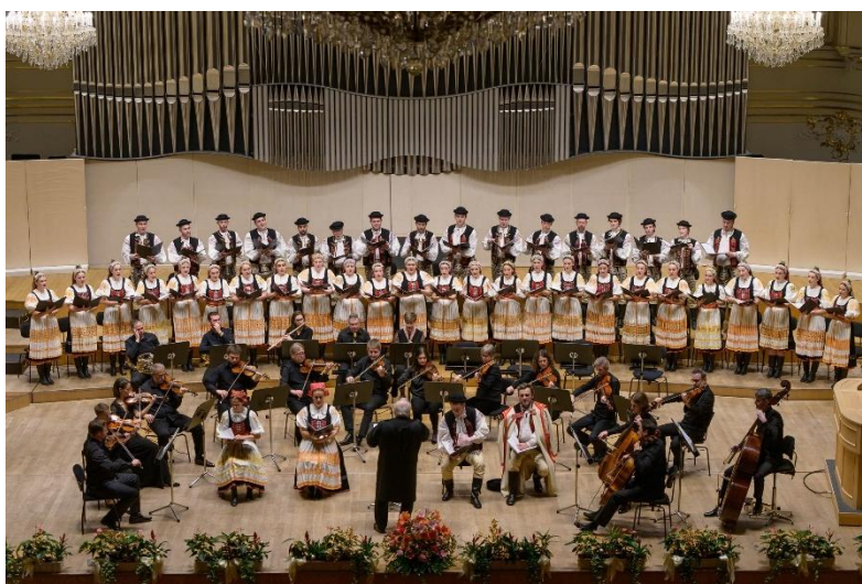
Adventný koncert, Koncertná sieň Slovenskej filharmónie, 14. 12. 2025