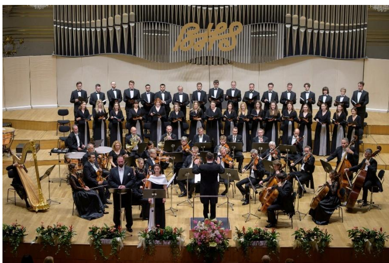
60. ročník Bratislavských hudobných slávností, Koncertná sieň Slovenskej filharmónie, 24.09.2025