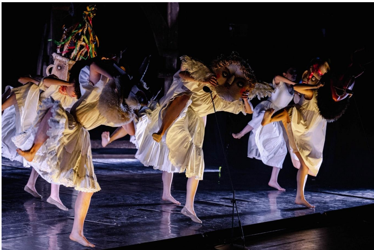
Predstavenie Koločas, Nová scéna Bratislava, 21.01.2025