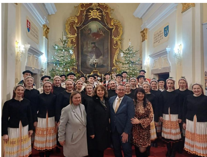
Vianočný koncert, Lúčnica nad Žitavou, 21. 12. 2025