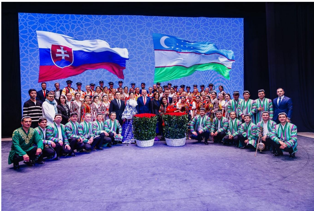
Predstavenie v Samarkande so súborom Bakhor, 31.10.2025