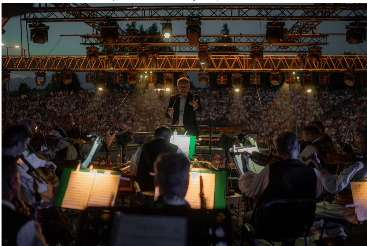
Predstavenie Svetozár Stračina, Festival Východná, 03.07.2025