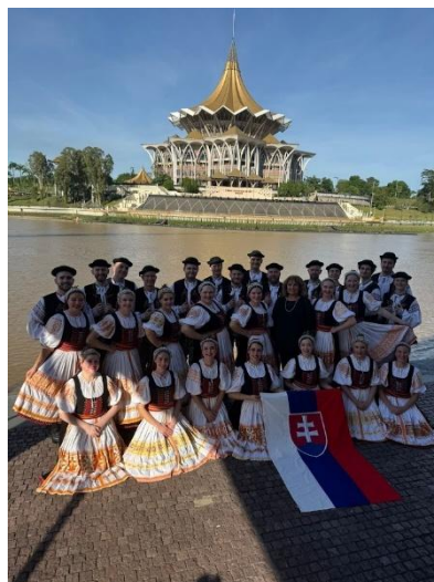
1. medzinárodná súťaž spevácky zborov Sarawak 2025, Kuching, Malajzia, 13.-22. 10. 2025