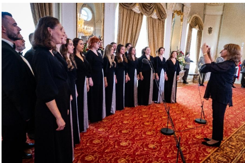
Odovzdávanie Štátnej ceny Alexandra Dubčeka, Úrad vlády SR, 01.09.2025