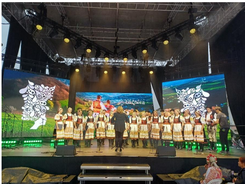
Slovenský deň kroja, Banská Bystrica, 30. 08. 2025